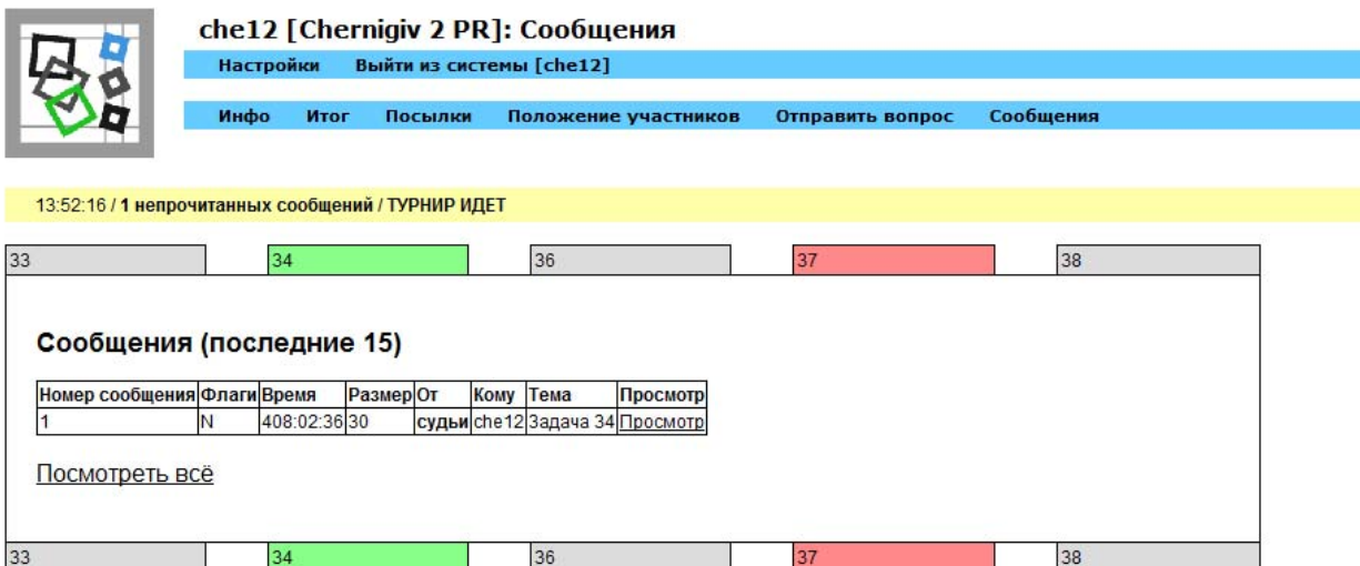
Рис. 3.8: Просмотр сообщений